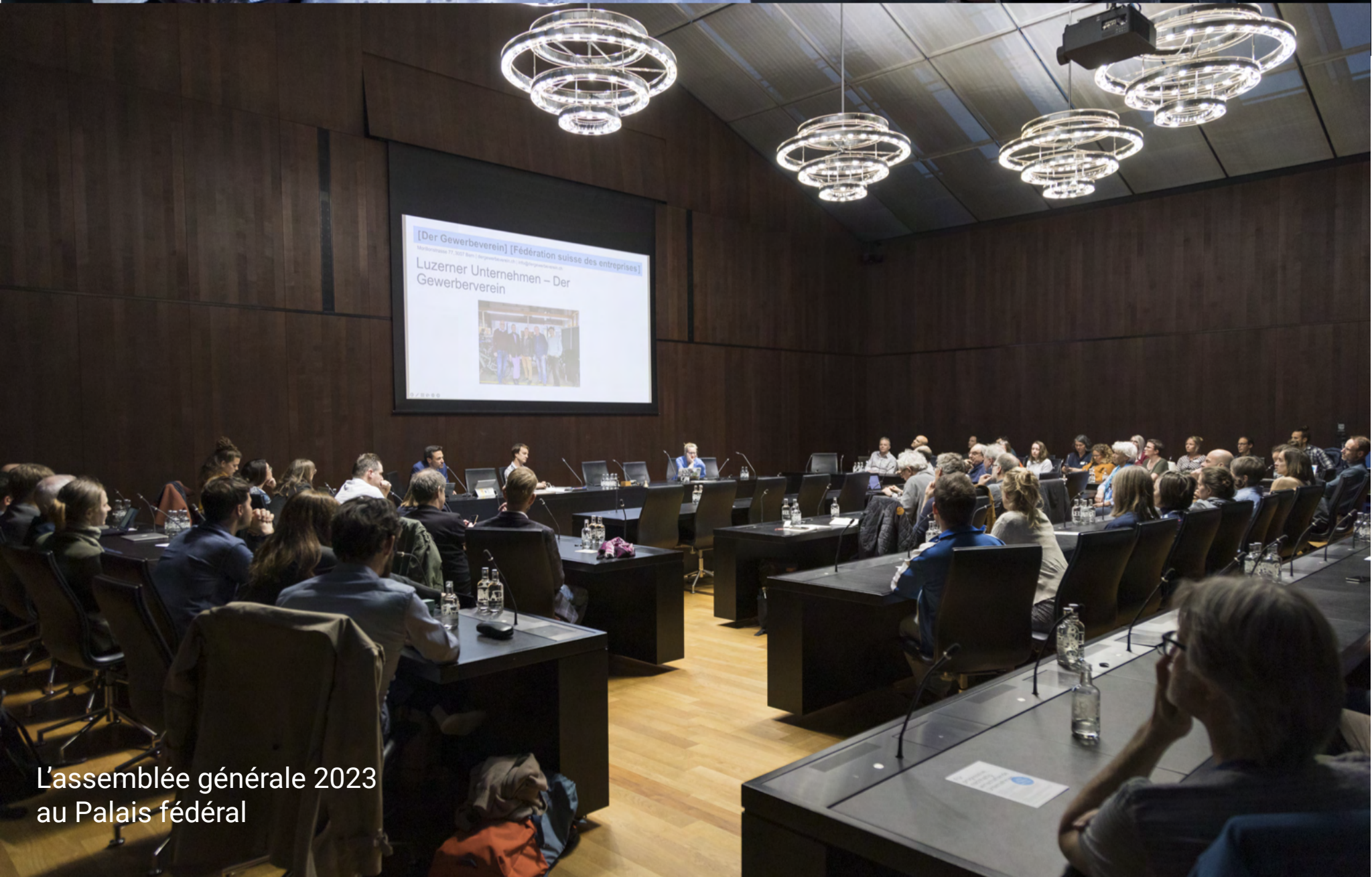
L'assemblée générale 2023 au Palais fédéral