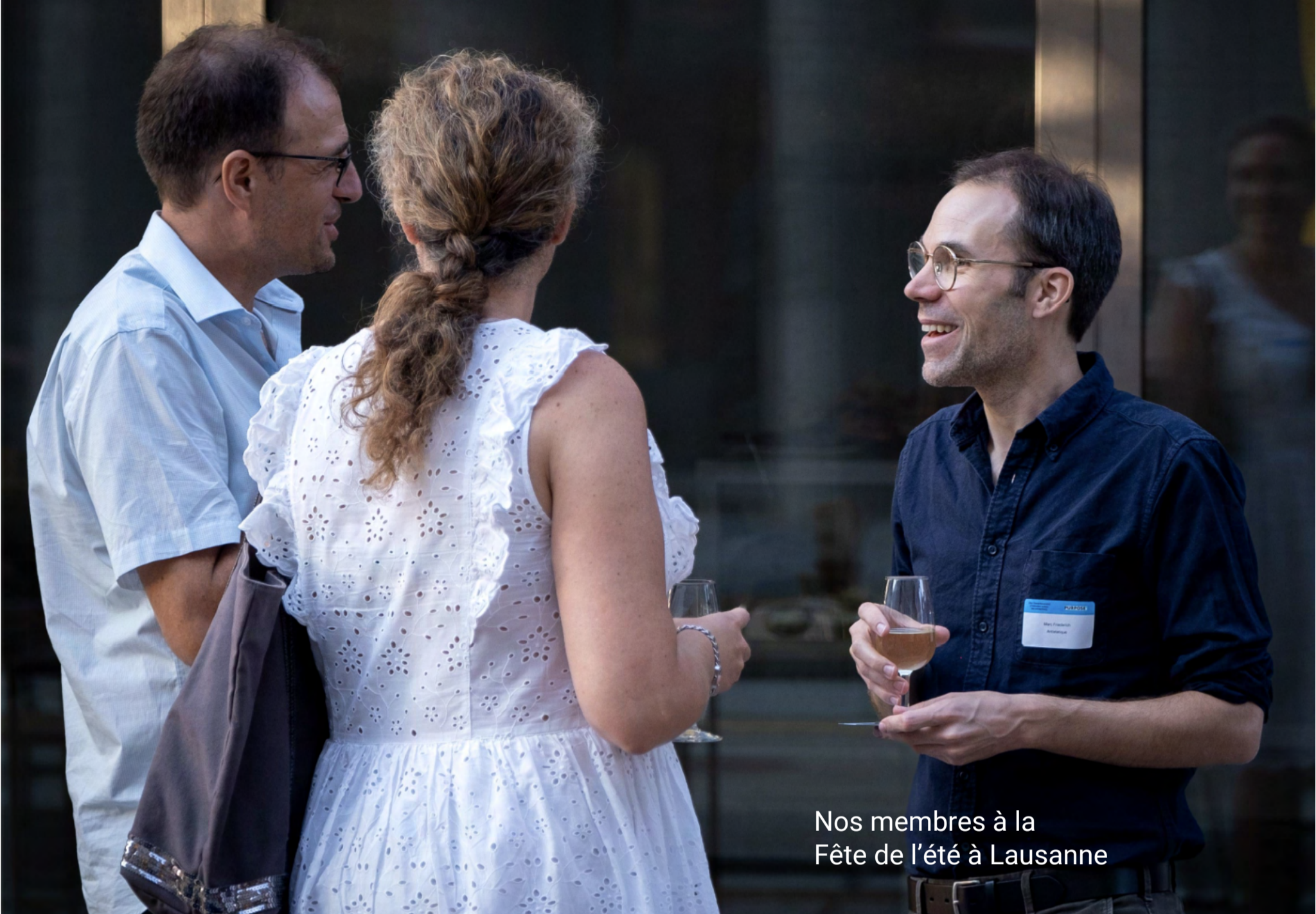
Nos membres à la Fête de l'été à Lausanne