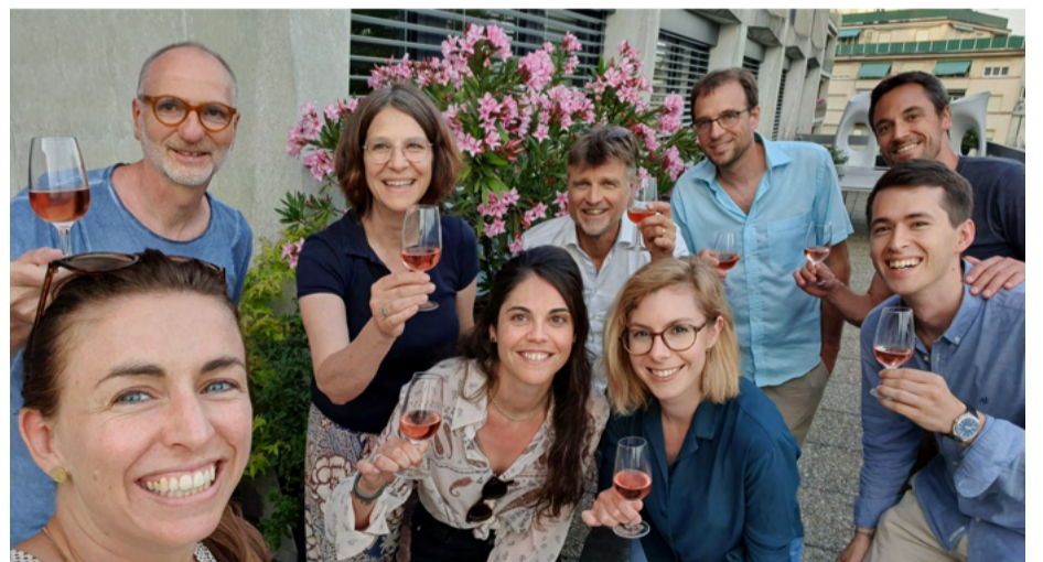
Le comité vaudoise après une séance.