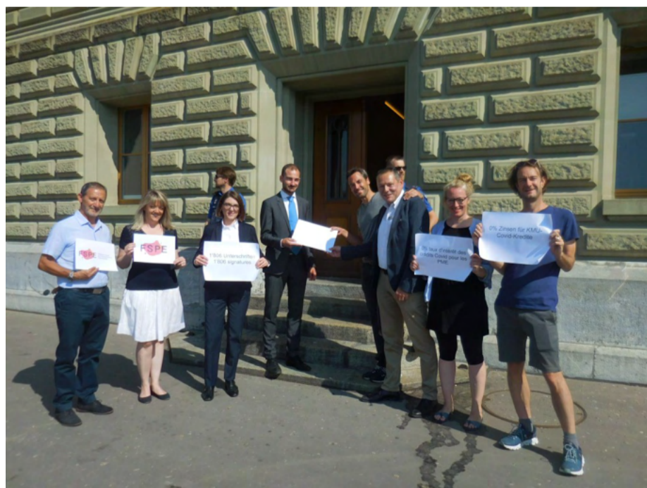
Dépôt de notre pétition auprès de la Chancellerie fédérale.

Pétition déposée : 1'806 entreprises réclament le maintien du taux Covid 0% - Actualité - Der Gewerbeverein (federationdesentreprises.ch)